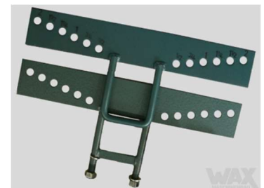
2" Ober- & Unterplatte